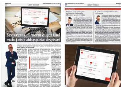
2 strony – rozkładówka

Artykuły promocyjne ukazują się w edycji papierowej, elektronicznej, a tydzień później w codziennym newsletterze (8 tys. odbiorców), na portalu gu.com.pl (50 tys. użytkowników miesięcznie), na Facebooku (20 tys. obserwujących) i na LinkedInie (21 tys. obserwujących).